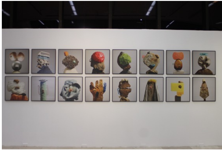
Vista de instalación CECUT, Tijuana, México, 2015 © Alejandro Pérez Falconi